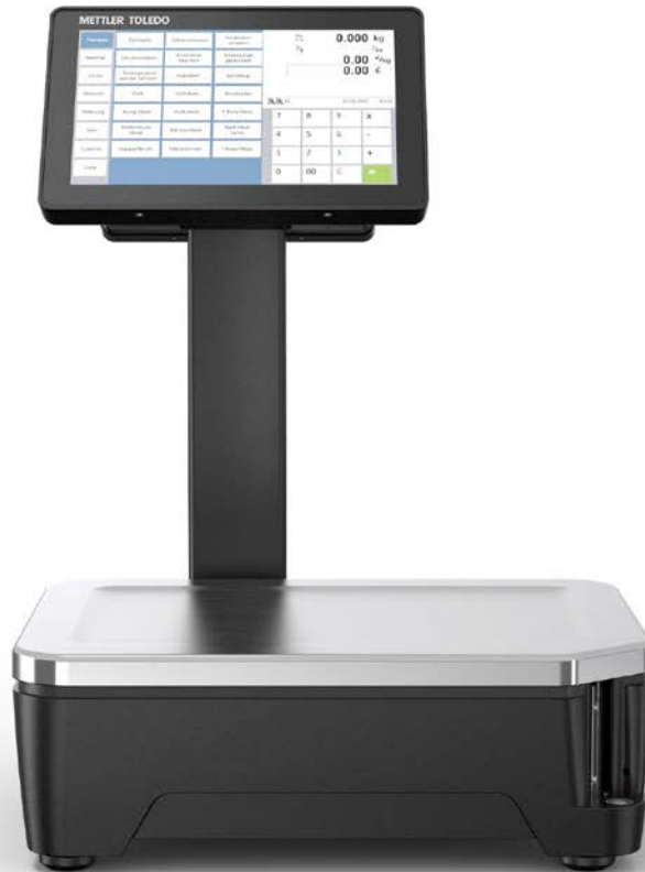
FreshBase Tower Waage

Bewährte Funktionalität, überzeugendes Preis-Leistungs-Verhältnis: FreshBase Line ist die neue Waagenfamilie für Lebensmitteleinzelhändler, die in die Leistungsklasse des Wiegens mit Touch-Komfort einsteigen möchten.